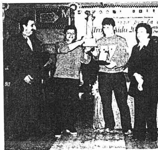
Trofeo Aido: immagini della edizione 2002