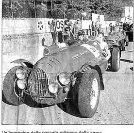
Un'immagine della passata edizione della corsa