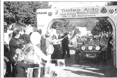
Il traguardo di Gardone Valrompia